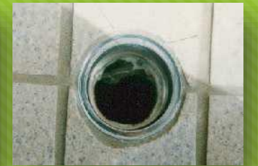
設置現場画像5 2~6ヶ月後