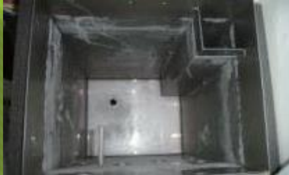
クーリングタワー②