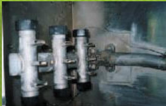
クーリングタワー①