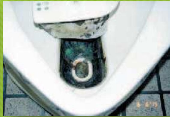
設置現場画像4 1~3ヶ月後